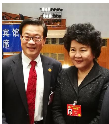
国侨办裘援平主任会见作为日本唯一列席全国政协十二届五次会议的在日侨领代表张述洲校长