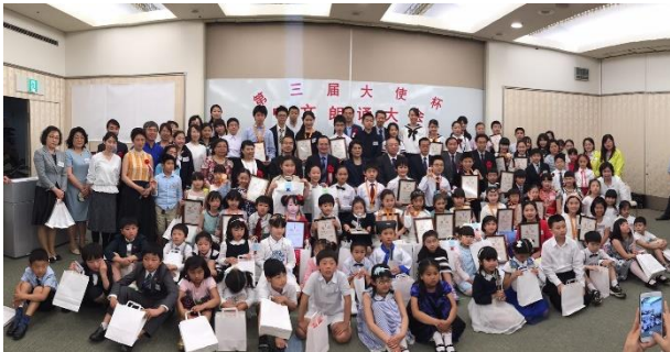
2017 年 5 月，第三届大使杯中文朗诵大赛在东京成功举行

目前，成千上万的在日华侨华人子女无法接受正规的、稳定的、全日制的华文教育，无法系统的、持续的学习中文和中华文化，甚至很难理解在海外作为炎黄子孙、龙的传人之自豪感与归属感。在这种情况下，众多在日有识之士毅然投身华文教育事业，以同源中文学校为代表的各种周末中文学校、中文补习班、兴趣班等如雨后春笋，屈壮成长，势头十分可喜。华文教师们长期无私奉献，毫无怨言，因为大家心中都有一个共同目标：一切都是为了孩子们！