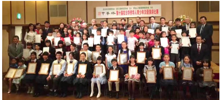
2016 年 12 月，第十届在日华侨华人青少年汉语演讲比赛在神户成功举行